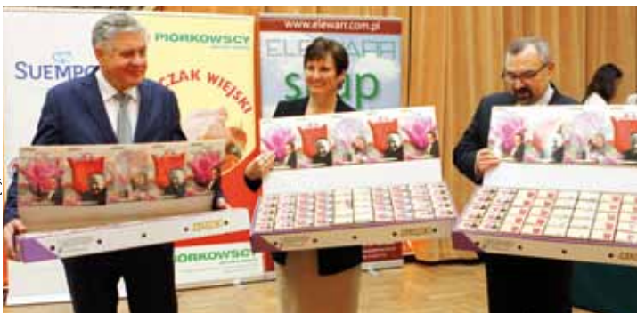
Oficjele obdarowani cebulkami tulipanów