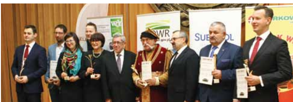
Fot. Arkadiusz Chomąży