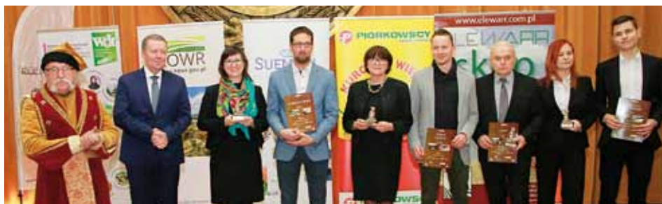
Wspólnie zdjęcie laureatów konkursu Kwatery na Medal 2017 przybyłych na Galę Agrobiznesu na SGGW z osobami wręczającymi (pozostałym uczestnikom konkursu nagrody zostały przesłane drogą pocztową)