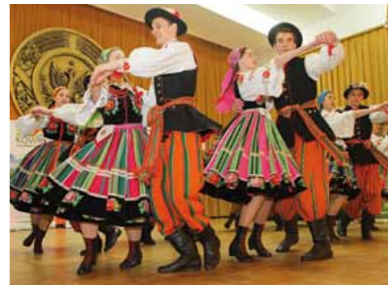
Zespół Pieśni i Tańca Blichowiaczy z Łowicza