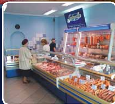
A to jeden ze sklepów