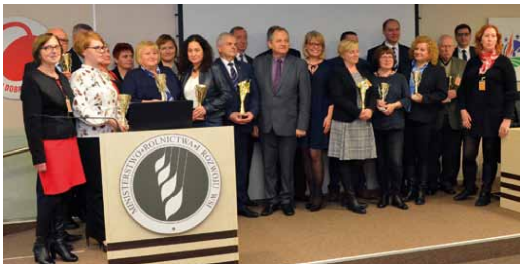
Wspólne zdjęcie zwycięzców i laureatów AgroKlasie ODR 2017 z min. Ryszardem Zarudzkiem