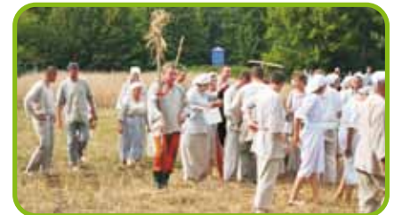
Wspieramy zespoły ludowe, ochotnicze straże pożarne oraz kofa gospodyń wiejskich