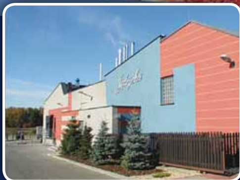
To nasz zakład