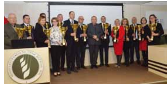
Z okazji Jubileuszu 25-lecia konkursu „Najlepsze wydawnictwo wojewódzkich ośrodków doradztwa rolniczego” redakcje wszystkich czasopism WODR w kraju zostało uhonorowanych specjalnymi pucharami Ministra Rolnictwa i Rozwoju Wsi