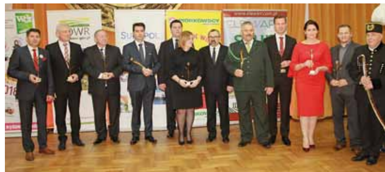
Sponsorzy Gali Agrobiznesu z rektorem SGGW