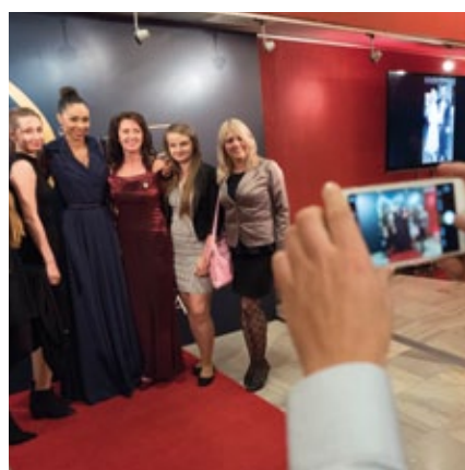
Pamiętkowe zdjęcie uczestników Gali KB Folie Polska w Teatrze Rampa